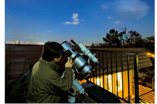
屋上にある天体望遠鏡

2世帯住宅の1階の屋根をフラットルーフ化。そして、そこを2階のダイニングキッチンから続くルーフバルコニーにして、親世帯、子世帯が集えるスペースにした。ルーフバルコニーには、2階屋上の天体観測用スペースへ登れる外階段を設置した