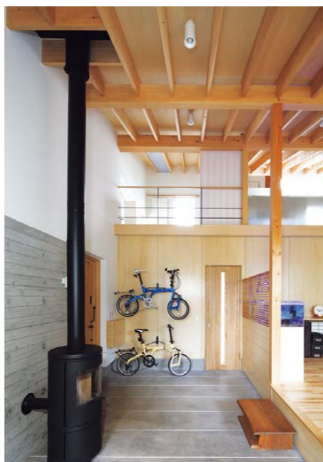
玄関から見た居間の隣にある自転車の整備スペース