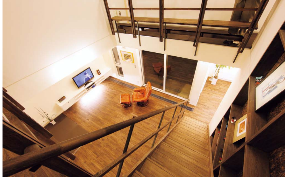
ダイナミックな吹き抜け空間を利用した巨大な収納スペース