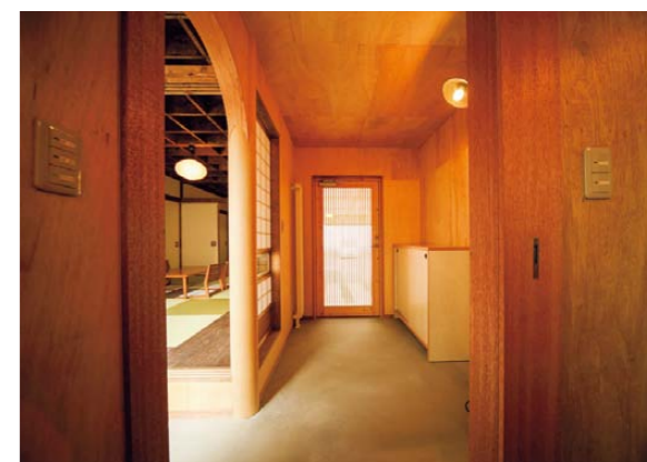
水回りと玄関を結ぶ土間 ②