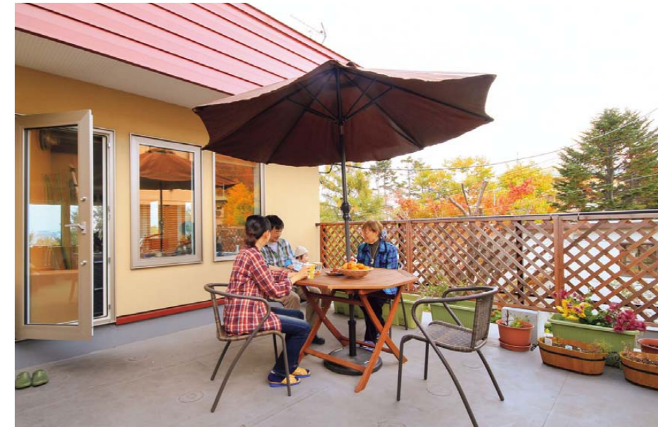
2階のダイニングキッチンからドア一枚でルーフバルコニーへ

ダイニングキッチンと直結したルーフバルコニーは、「外空間」のダイニングルームになる。部屋から気軽に天体観測用スペースまで行けるので、好きな時に星空を眺めることができる