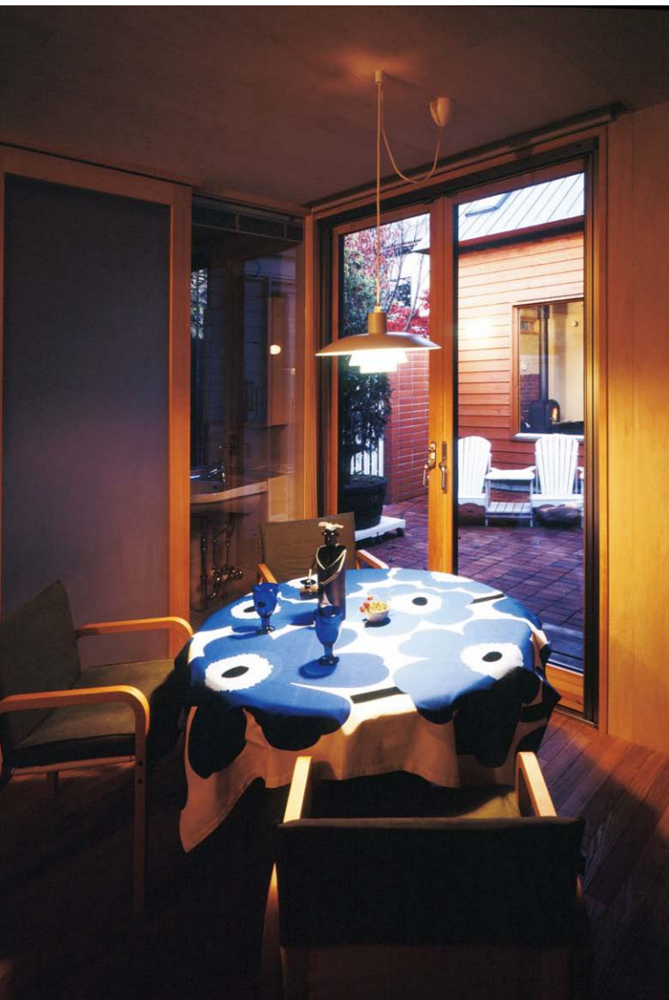
コの字の左側にあるダイニングルーム