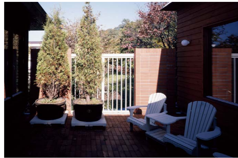
演奏ルームとダイニングルームの真ん中にある中庭