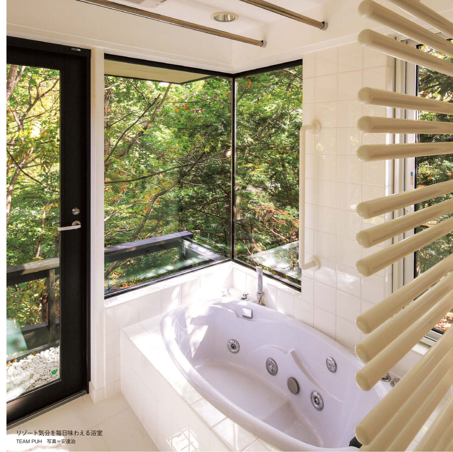
リゾート気分を毎日味わえる浴室 TEAM PUH

中庭を設けたことで、部屋にいながら自分の家が見えるという新鮮な気分が味わえる。また、庭のプライバシーが保たれるので、人目を気にせずいつでも庭に出ることができる。その結果、庭が部屋の一部として利用できるようになる