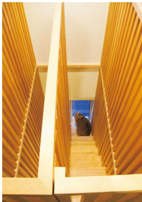
2階から見下ろした猫階段。踊り場には小窓を設置 ②