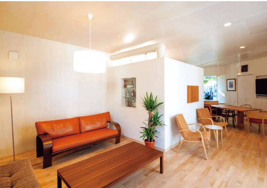
リビングから見たキッチン(中央)とダイニング(奥)