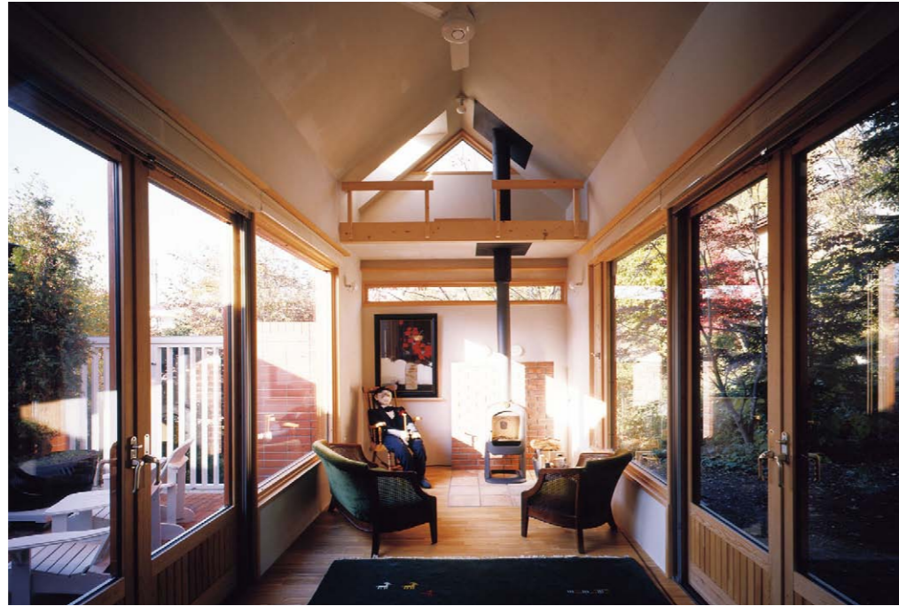
コの字の右側にある演奏ルーム。奥には薪ストーブがある