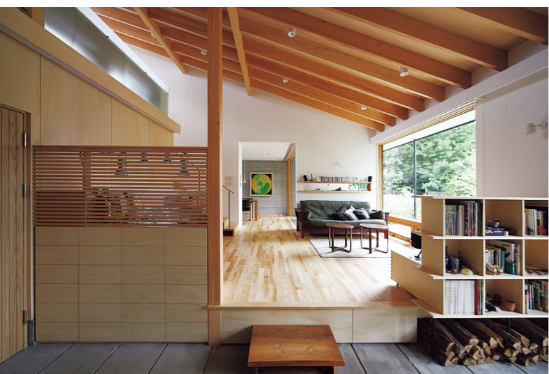
土間から見たリビング