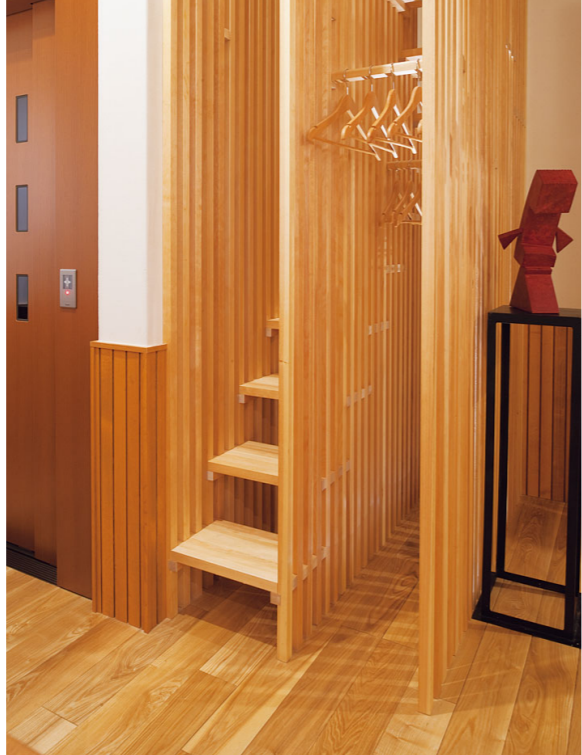
1階にある猫階段の入口(左)。その隣はクロゼット ①