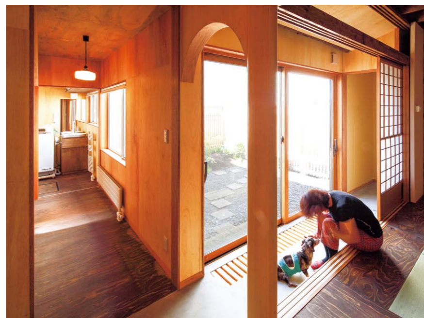
土間を介して居室、水回り、庭、玄関への動線を確保 ①

水回りと居室の間に土間を設置し、土間から玄関、庭へ出られるようにした。そのために、水回り、居室、玄関、庭の中心に位置した土間が動線の「ハブ」的役割を果たすようにした