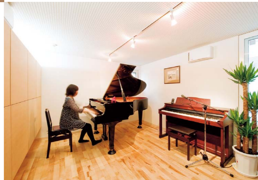
壁(左)の一面には造り付け収納を設置。楽譜などが収められている