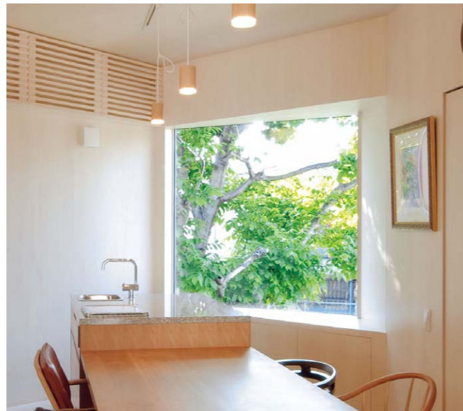
ダイニングテーブル奥にはパーティー用のオープンキッチンを設置